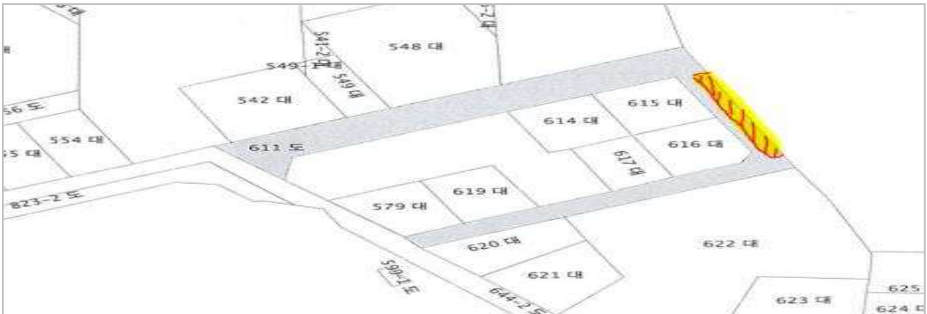
위 치 도