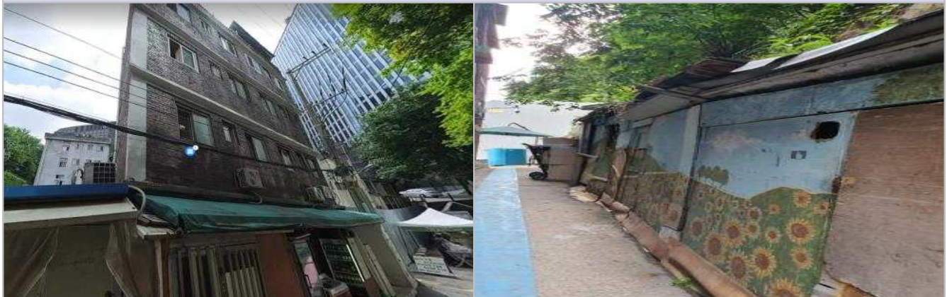
현 황 사 진