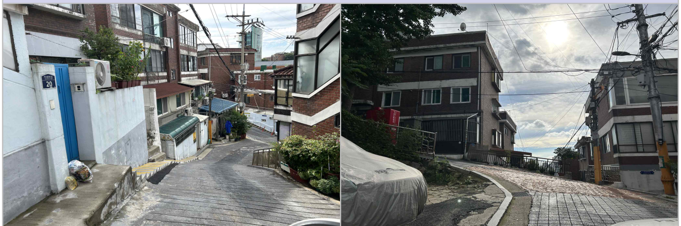
현 황 사 진