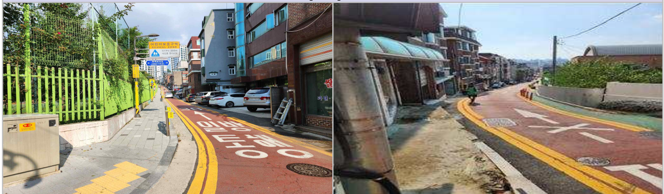
현 황 사 진