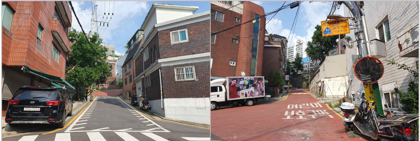
현 황 사 진