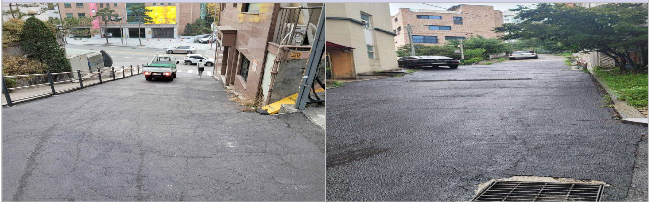
현 황 사 진