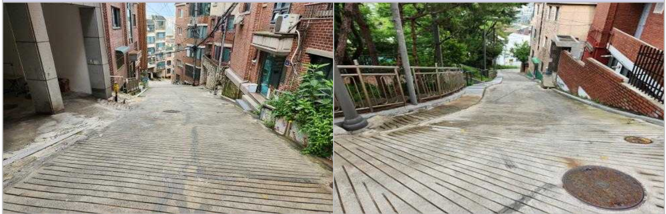
현 황 사 진