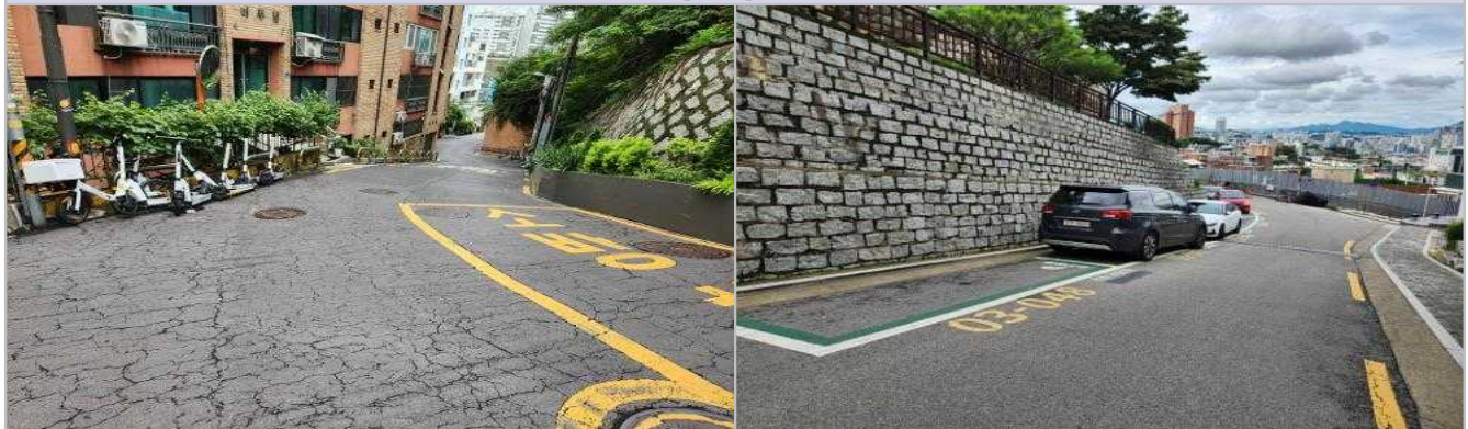
현 황 사 진