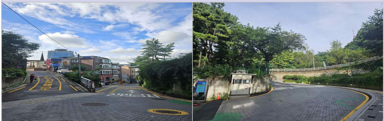
현 황 사 진