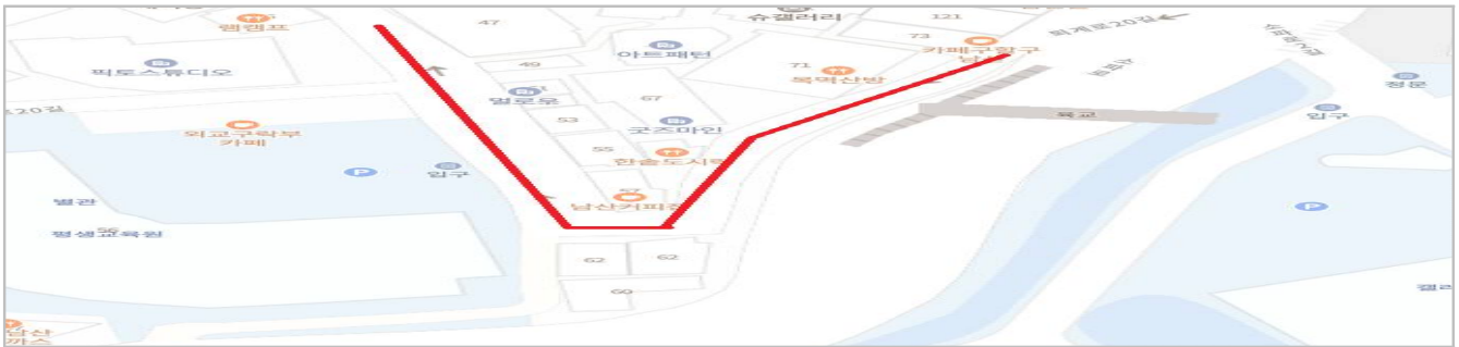
위 치 도