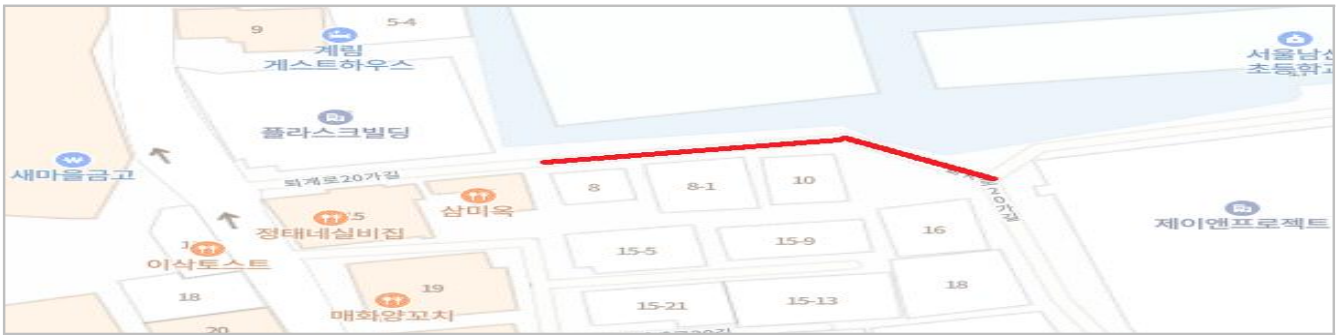
위 치 도