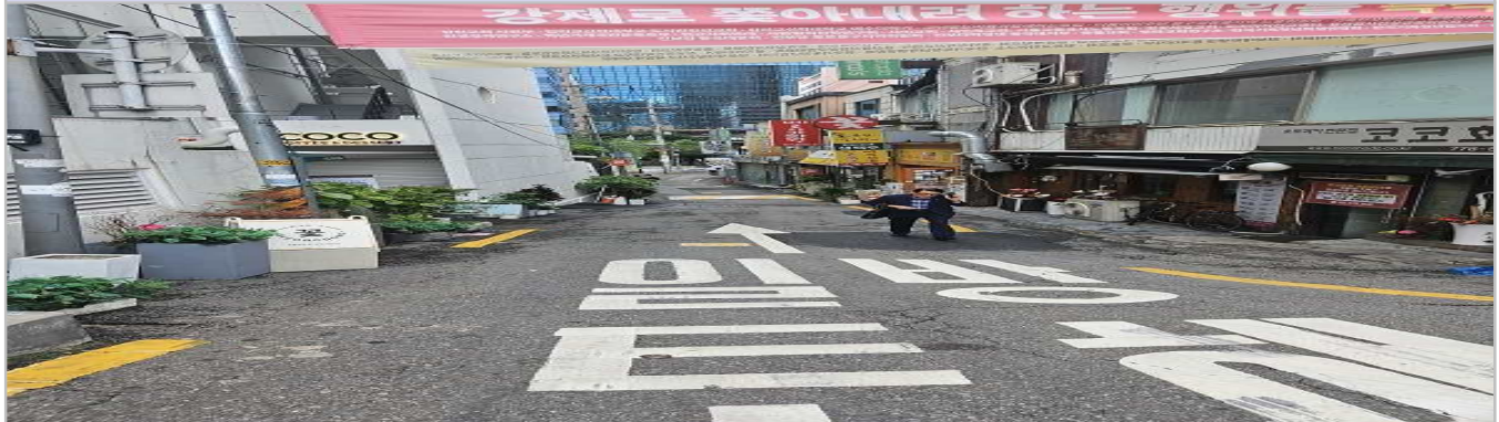
현 황 사 진