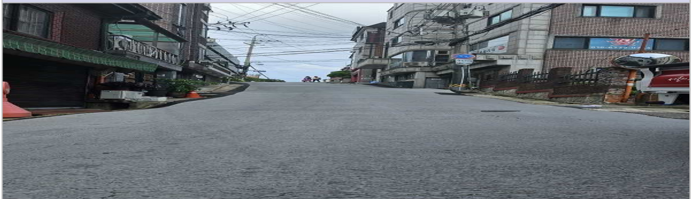
현 황 사 진