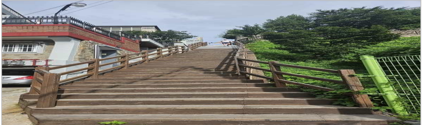
현 황 사 진