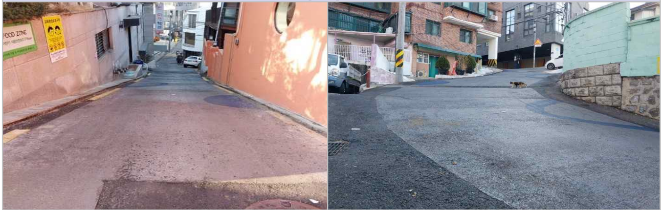
현 황 사 진