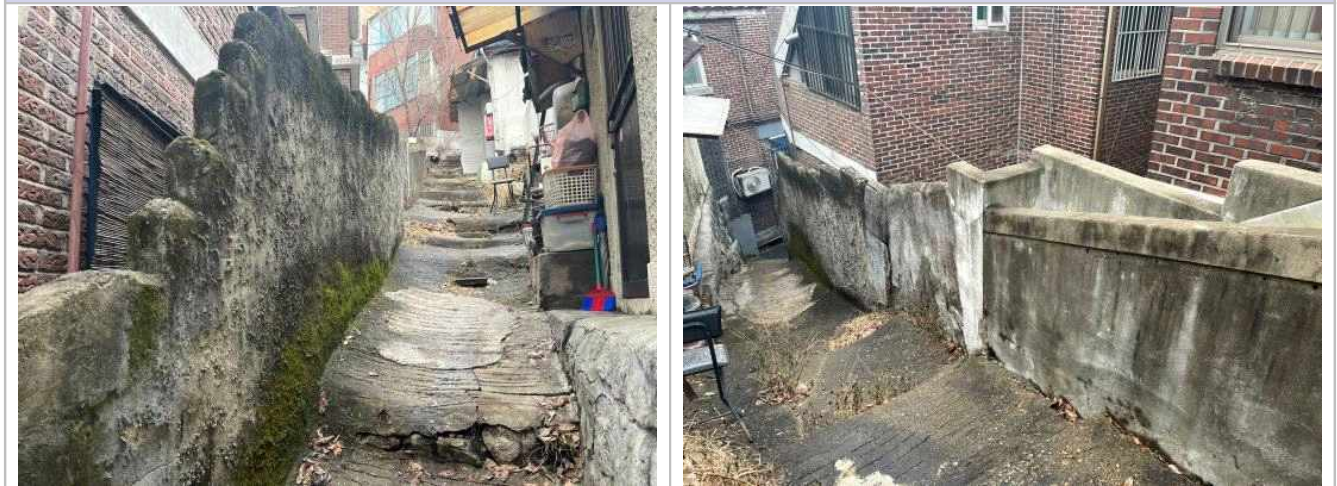
현 황 사 진