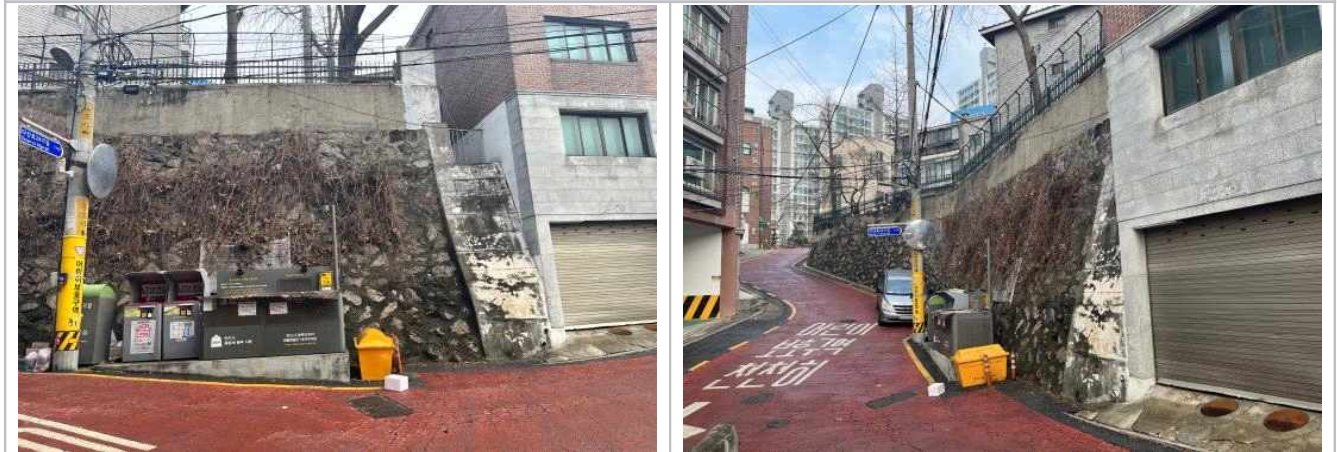
현 황 사 진