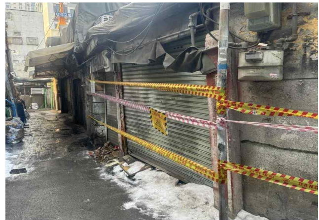
현 황 사 진