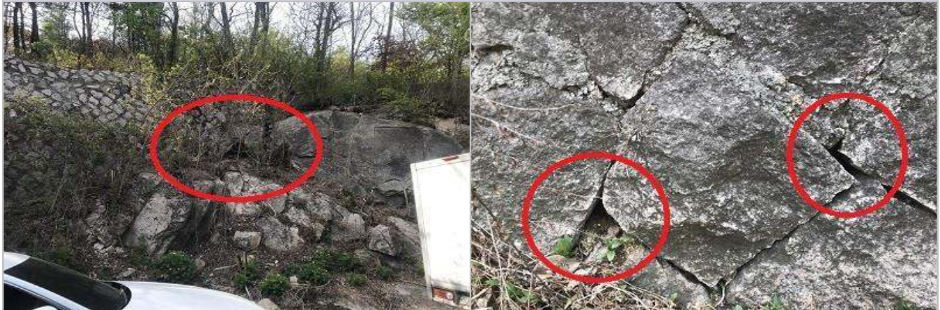
현 황 사 진