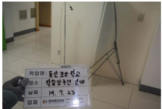
작업장 주변 실내