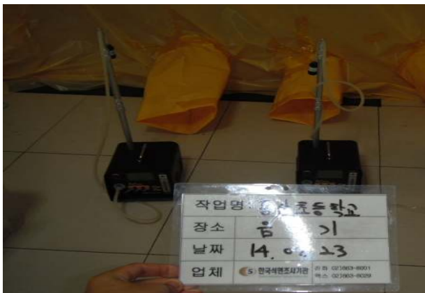
음압기 1, 2