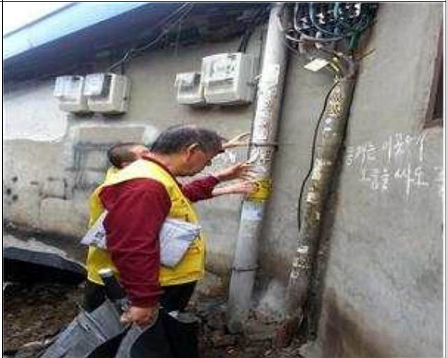
관내 우범지역 순찰