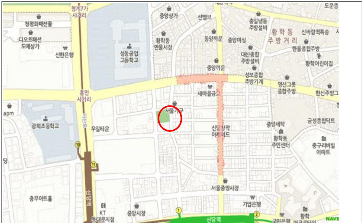
위 치 도(황학동 755)