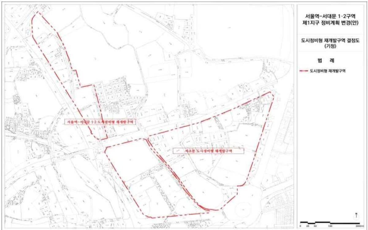
〈 도시정비형 재개발구역 결정도 (기정) 〉