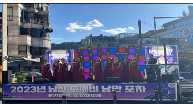
관내 동아리 무대공연