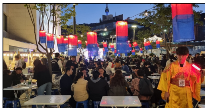
필동 상점가 먹거리포차