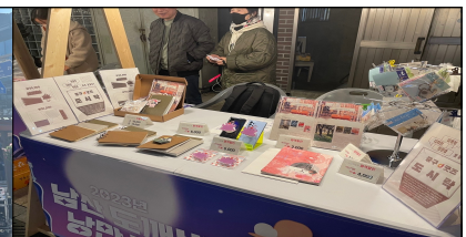
관내 업체 플리마켓 운영