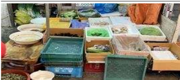
아트테리어 사업 전