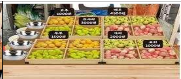
아트테리어 사업 후