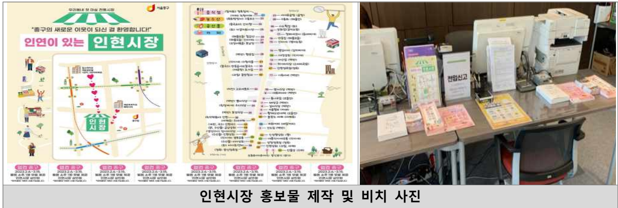
인현시장 홍보물 제작 및 비치 사진