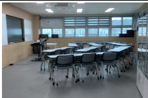
학교 음악실 개선 (50백만 원)