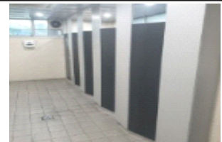
남녀 화장실 공사 (110백만 원)