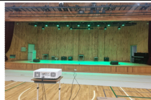
체육관 등 개선 (50백만 원)