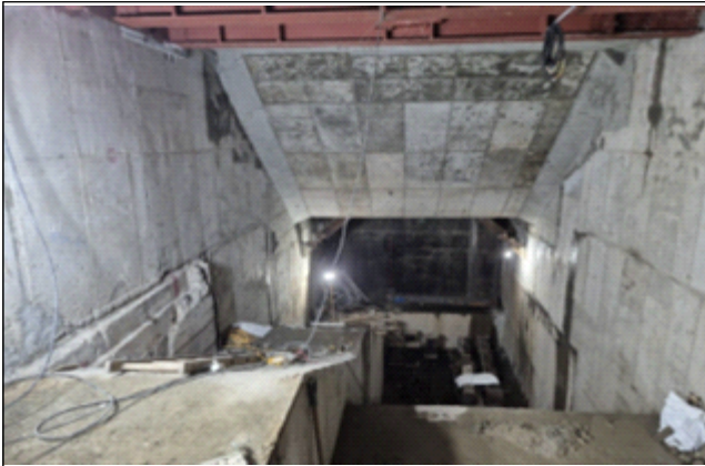
연결통로 구조물 설치