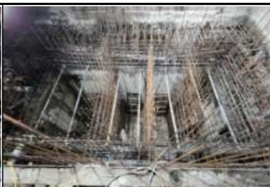
정화조 벽체철근 배근