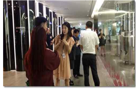
중국 의료관광 팸투어(차병원)