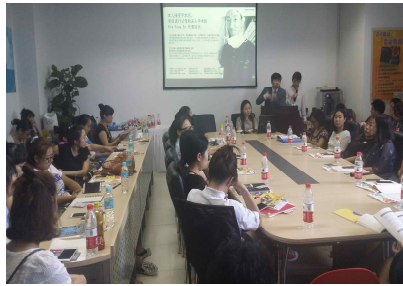
중국 의료관광 설명회