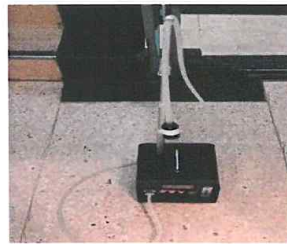
#5 거주자 주거지역