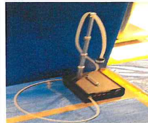
#7 작업장 실내