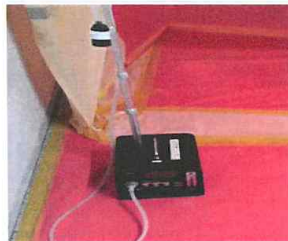
#6 위생설비 출입구