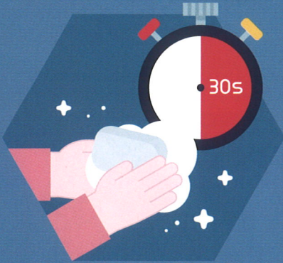
비누를 사용해 30초 동안 충분히 손 씻기