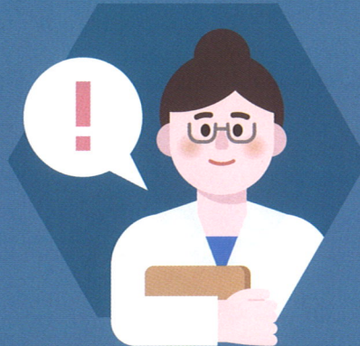
감염병 의심 환자가 발생 시 즉시 보건교사에게 알리기