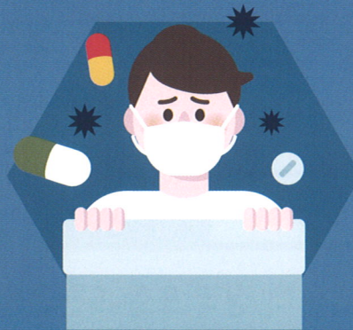
격리치료 중에는 다른사람에게 전파되지 않도록 각별히 주의