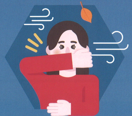
옷소매로 기침예절 실천하기