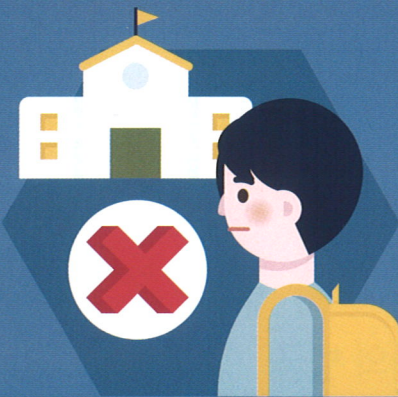
감염 환자는 격리기간 동안 등교하지 않기